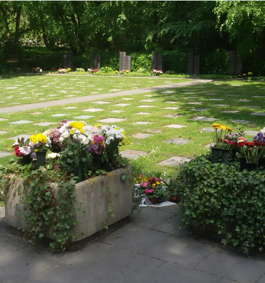
Waldfriedhof Grabfeld 3-17