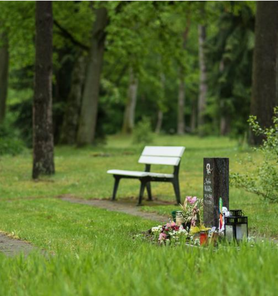
Waldfriedhof Grabfeld 2-34