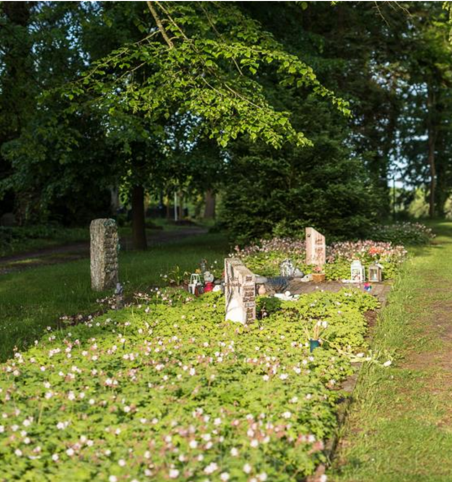
Alter Friedhof Grabfeld Via