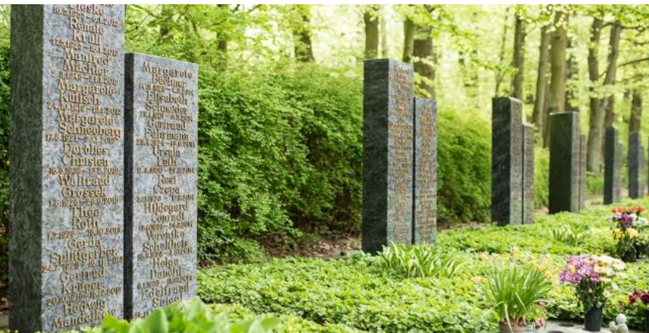
Beispiel Waldfriedhof Grabfeld 3-17