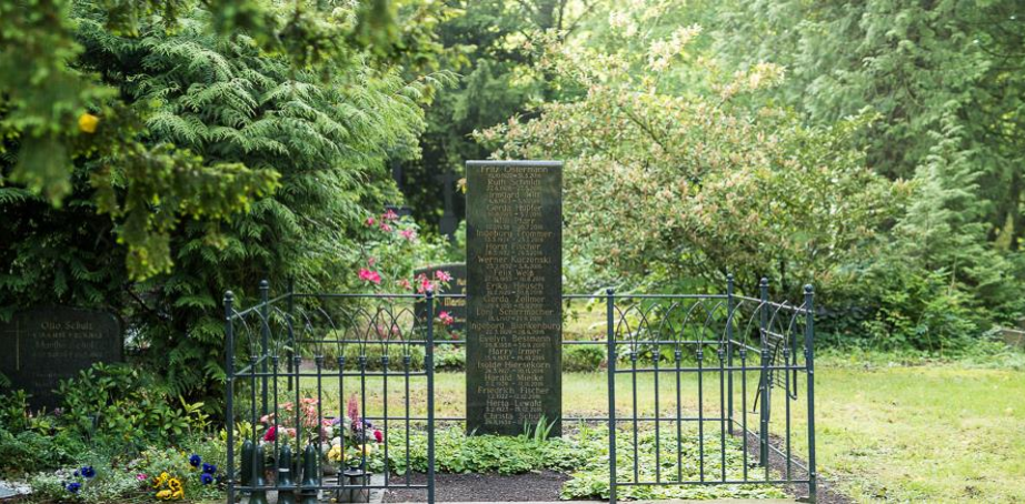
Beispiel Alter Friedhof Grabfeld X-Erd