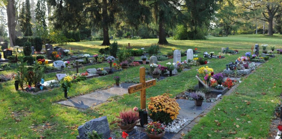
Beispiel Alter Friedhof Grabfeld XXK Urne