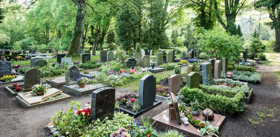
Beispiel Alter Friedhof Grabfeld CA Urne