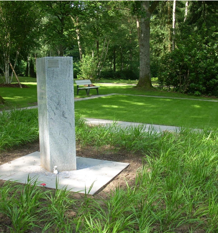
Waldfriedhof Grabfeld 2-34