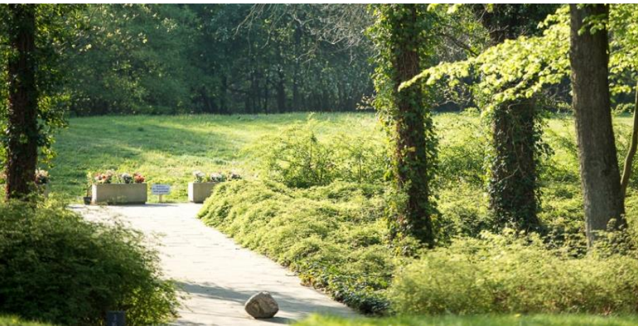
Waldfriedhof Urnengemeinschaftsanlage 2