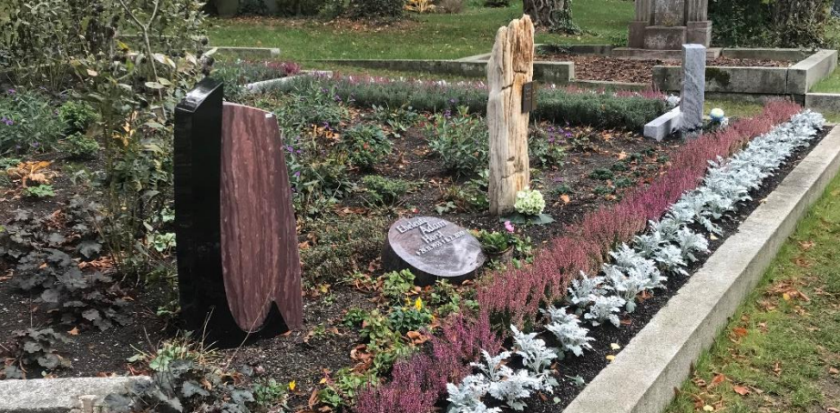
Alter Friedhof Bestattungsgarten