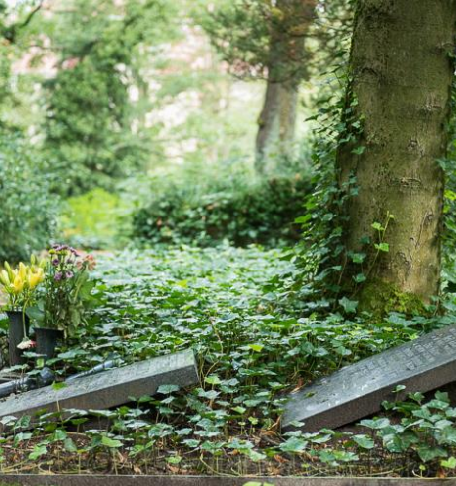
Beispiel Alter Friedhof Grabfeld X-Erd