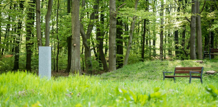
Waldfriedhof Baumgrabfeld 3-19