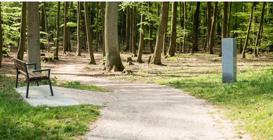
Waldfriedhof Baumgrabfeld 3-19