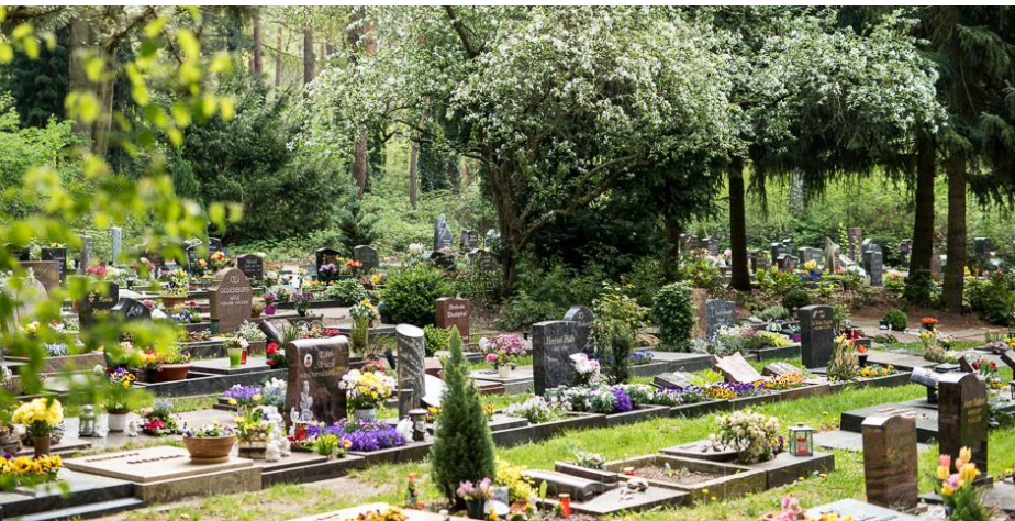
Beispiel Waldfriedhof Grabfeld 3-04