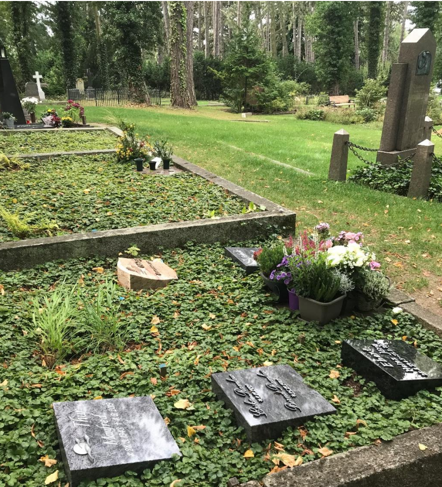
Alter Friedhof Grabfeld B