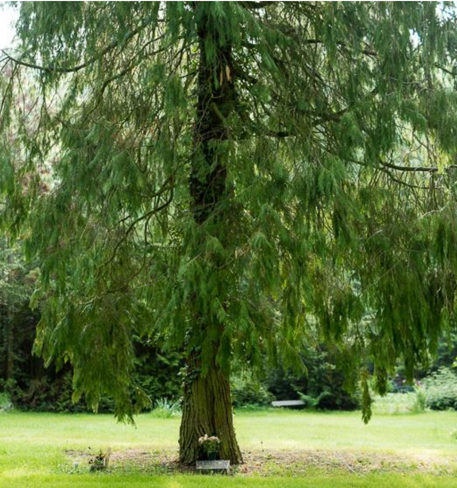
Beispiel Alter Friedhof Baumgrabstätte IVa