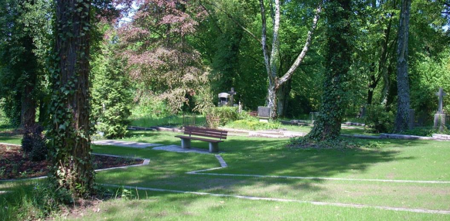
Alter Friedhof Urnengemeinschaftsanlage Grabfeld B