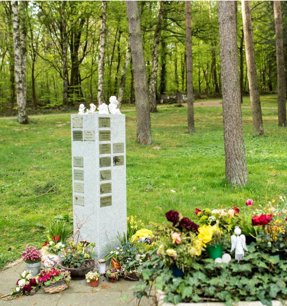
Beispiel Waldfriedhof Baumgrabfeld 3-44