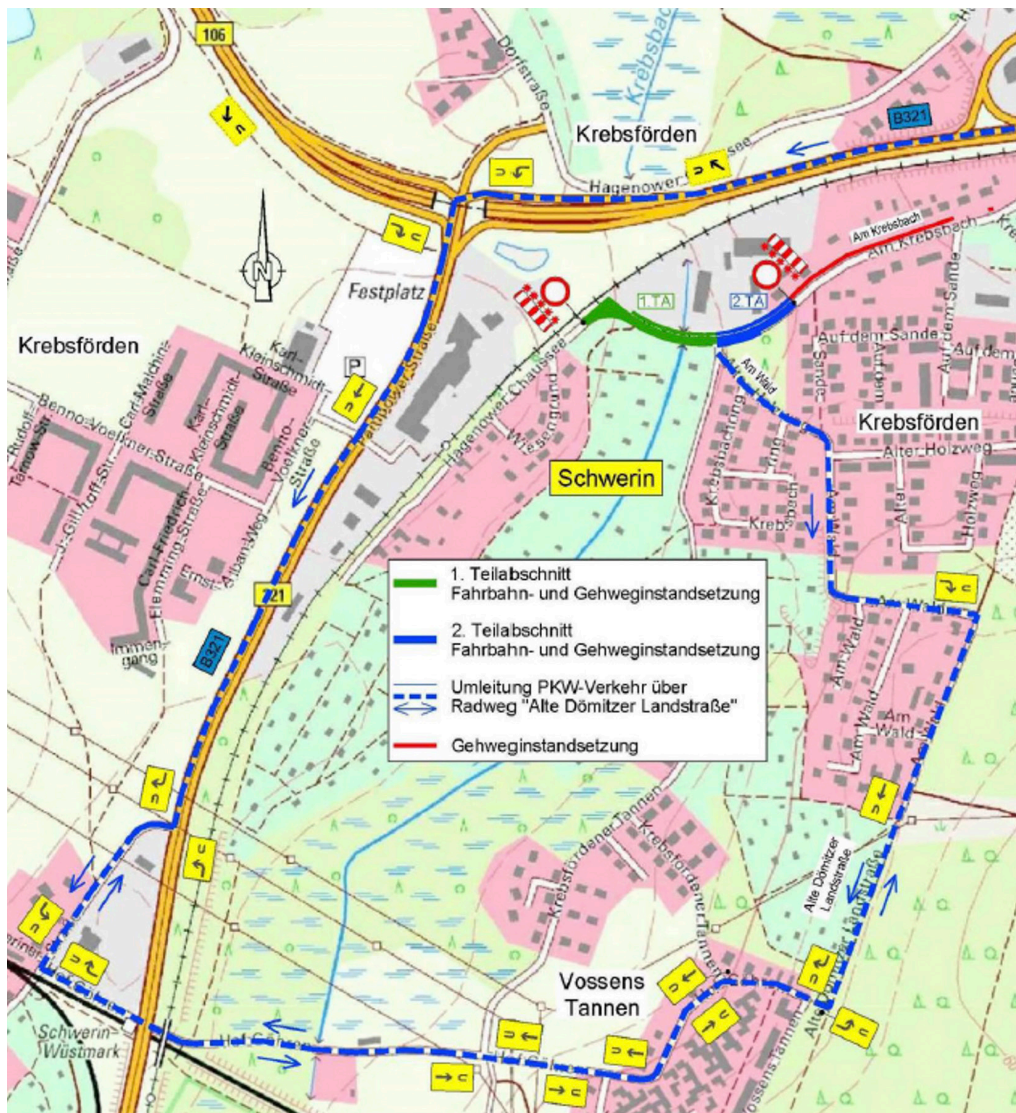
Blick auf den Umleitungsplan und die verschiedenen Teilabschnitte der Baumaßnahmen bei der Fahrbahn- und Gehweginstandsetzung Am Krebsbach