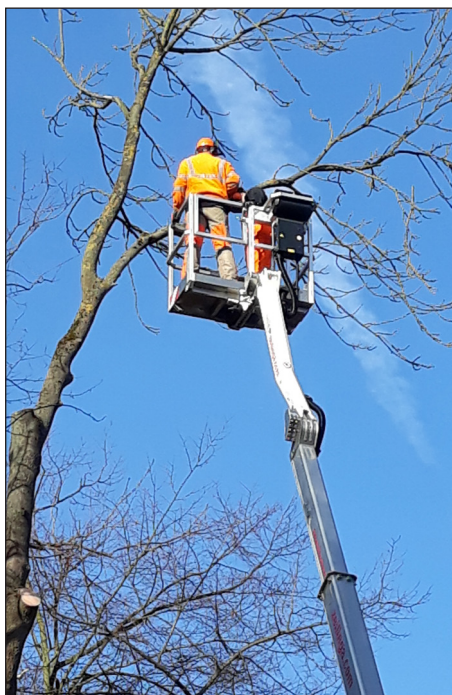
Auch Arbeiten von der Hubarbeitsbühne sind Teil der Baumpflege